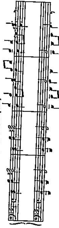
Пример 25 «Смерть Озе»

В своих путешествиях Пер Гюнт попадал в самые разные страны. Вот танцует перед ним свой легкий, воздушный танец арабская девушка Анитра. Пер от удивления разинул рот: не так танцуют девушки в его родной деревне.